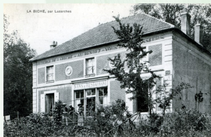
La Biche – Relais de chasse

Devant la tour du manoir, tourner à droite puis première à gauche et passer devant le poney club de la sente. Continuer sur le sentier qui croise l'Ysieux vers la départementale 922. A ce niveau, longer le champ puis descendre à droite dans le chemin creux « voirie de sécheron » qui remonte jusqu'à la ferme en bordure de la route d'Hérivaux. Tourner à gauche sur cette route. Au niveau du moulin de Luzarches, reprendre le GR1 (balisage blanc-rouge) au niveau d'un « Y ». Rejoindre le parking de l'église à vue.