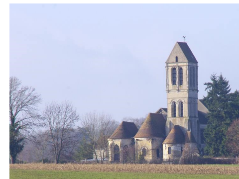
Eglise Saint-Côme et saint-Damien

Au carrefour tourner à droite puis à gauche au carrefour suivant. Continue sur le plateau qui surplombe le hameau de Thimécourt. Après 800m environ, quitter le chemin principal pour descendre à droite sur le chemin creux en contre bas.