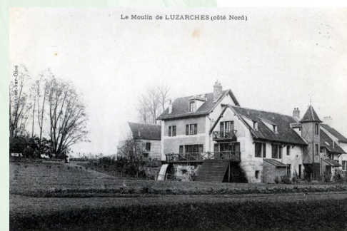
Moulin de Luzarches