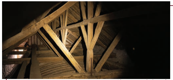
Charpente de la nef

Une fois hissés hors de la crypte, nous nous dirigeons vers le clocher. La petite porte s'ouvre sur un étroit escalier en colimaçon. En haut de celui-ci, il faut ensuite se baisser sous une première poutre pour entrer dans les combles et commencer à découvrir les charpentes. Les vieilles poutres en bois sont toutes imbriquées tel un parfait puzzle. L'ensemble témoigne de la grande maîtrise des artisans et ouvriers d'autant. Ces charpentes avaient toutes été restaurées au XVI ème siècle. Nous traversons les charpentes de la chapelle Saint-Côme, puis du chœur, plus loin, une ouverture dans le toit nous donne vue sur le cimetière. Nous continuons ensuite vers la chapelle de la Vierge puis du bas-côté droit, dont nous reconnaissons les formes des voûtes. La charpente de la nef n'est quant à elle accessible que par le toit. Un rapport d'expertise montre néanmoins la grande ingéniosité de sa construction. Le poids est savamment redirigé sur les murs et sa base est incorporée dans le plafond en plâtre de la nef (la marque des poutres est visible depuis l'intérieur de l'église). Une charpente sur-mesure tout à fait remarquable et unique.