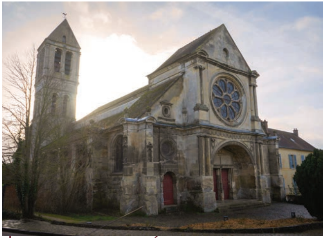
Église Saint-Côme & Saint-Damien

Classée monument historique depuis 1912, l'église Saint-Côme & Saint-Damien est l'un des joyaux du patrimoine luzarchois, unique dans beaucoup de ses aspects parmi les nombreuses églises de la région.