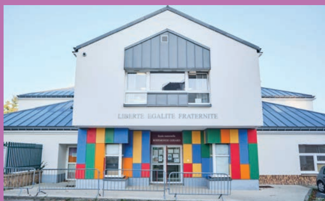
📍 ÉCOLE MATERNELLE ROSEMONDE GÉRARD

Adresse : Place de la Garenne Contact : 01 34 71 20 90