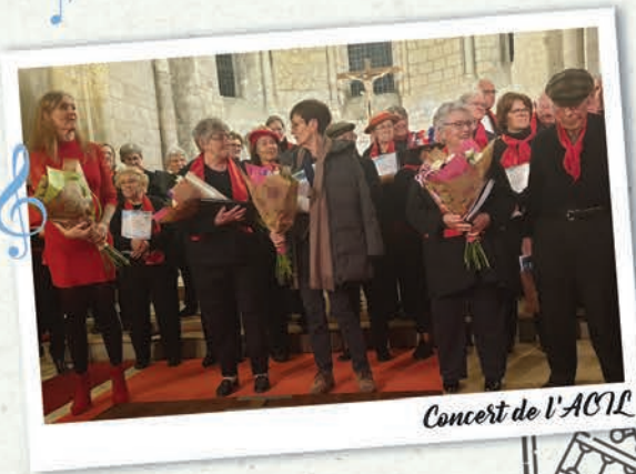
Concert de l'ACSL