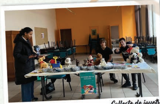
Collecte de jouets