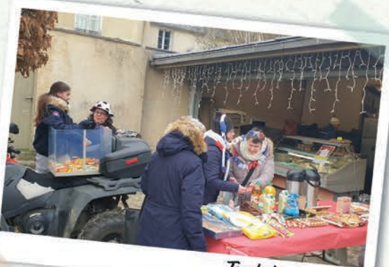
Tombola du marché