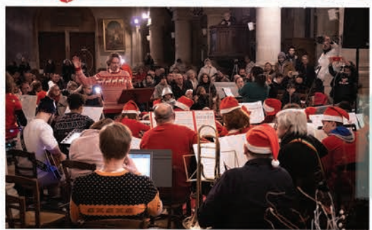
Concert de Noël