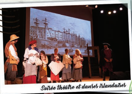
Soirée théâtre et danses irlandaises