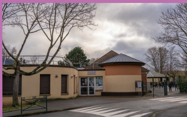
📍 ÉCOLE ÉLÉMENTAIRE LOUIS JOUVET

Adresse : Place de la Garenne Contact : 01 34 71 20 90