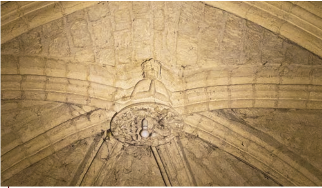
Tête sculptée de Saint-Louis

Dans cette chapelle Saint-Côme est « cachée » l'entrée de la crypte de l'église. Derrière l'hôtel, une lourde dalle en béton ferme l'accès. Notre visite est l'occasion de la soulever. Le trou permet de descendre dans une salle étroite et très basse. Des fouilles archéologiques avaient permis d'y découvrir plusieurs sarcophages de la période mérovingienne (V ème - VIII ème siècles). Nous sommes d'ailleurs surpris d'y trouver des ossements encore empilés. Les premières fondations de l'église se révèlent également. Un premier édifice gallo-romain était déjà bâti à cet endroit à l'époque, puis rasé par les pillages. Une chapelle romane a ensuite été érigée par-dessus au VIII ème siècle. Un diplôme de Charlemagne datant de 775 atteste d'ailleurs l'existence d'une église « Saint-Côme et Saint-Damien » à Luzarches. Ses premiers vestiges sont donc devant nos yeux.