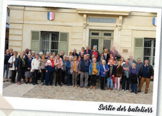
Sortie des bateliers