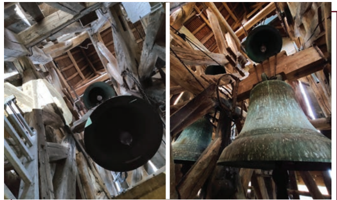
L'intérieur du clocher

Nous faisons ensuite demi-tour pour retourner au clocher et terminer notre ascension. Un nouvel escalier en colimaçon est à emprunter. La moitié d'un pied tient à peine sur ces petites marches. Nous arrivons au premier étage. Avant 1537, nous nous serions arrêtés ici. En effet, une campagne de travaux lancée à cette époque a permis l'adjonction d'un second étage de style Renaissance, contrastant avec le style roman du premier. Pour ce dernier étage, les architectes n'avaient pas prévu d'escalier... La dernière dizaine de mètres est à gravir sur une échelle. Un dernier effort pour entrer dans la demeure de Honorine, Emilie, Gustave et Renée. Elles sont les quatre cloches de l'église Saint-Côme & Saint-Damien. Toutes sont installées là-haut depuis les années 1870, sauf Renée, la petite dernière, venue remplacer Grosse Juliette en 1993 (elle repose aujourd'hui derrière le clavier de l'orgue).