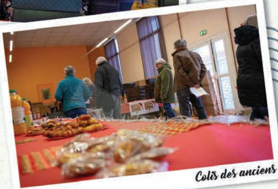
Colis des anciens