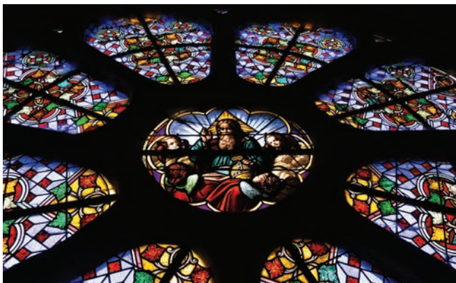
Rosace de l'église

Remontant la rue François de Ganay, un premier arrêt permet d'admirer la façade avant de l'édifice. Le clocher domine, derrière la vue de cette grande rosace reconnaissable, nichée au-dessus du portail richement orné. Ce n'est pas par là que nous entrerons dans l'église, mais par le presbytère. Une petite porte située à côté de la chambre du prêtre, permet d'accéder à un vieil escalier menant au grenier. Là-haut, nous arrivons devant une étroite porte, derrière laquelle résonne l'orgue de l'église. Il faut se mettre de côté pour entrer.