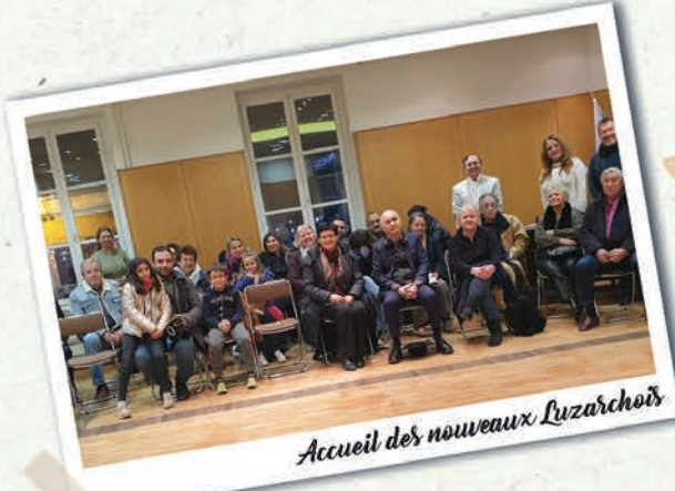
Accueil des nouveaux Luzarchois