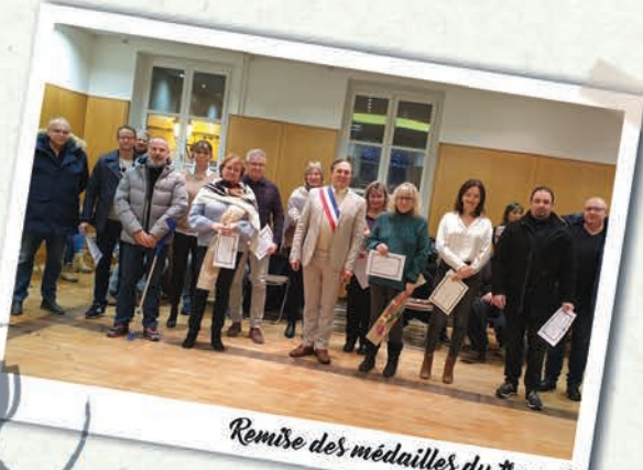
Remise des médailles du travail