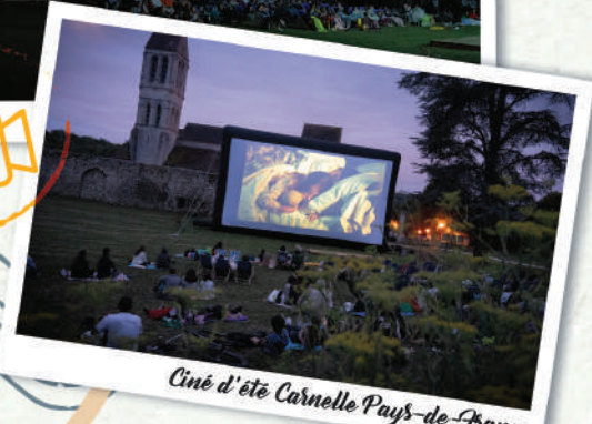
Ciné d'été Carnelle Pays-de-France