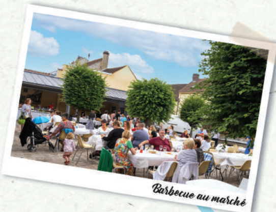
Barbecue au marché