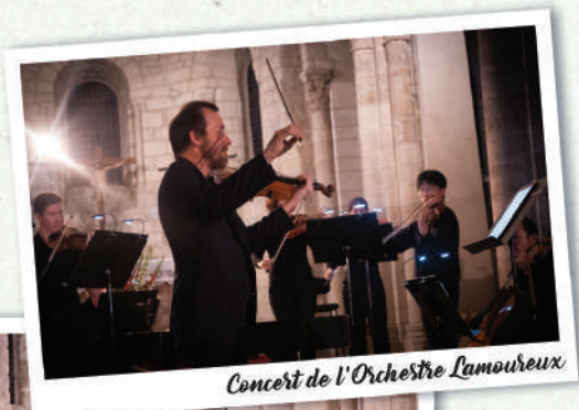
Concert de l'Orchestre Lamoureux