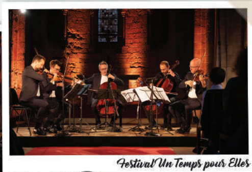
Festival 'Un Temps pour Elles'