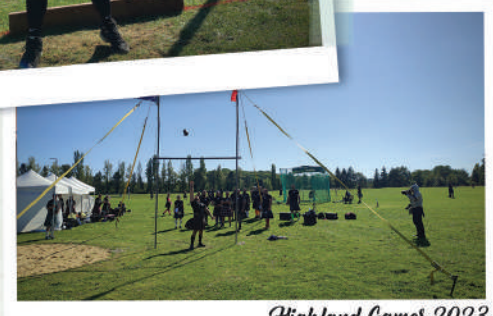
Highland Games 2023