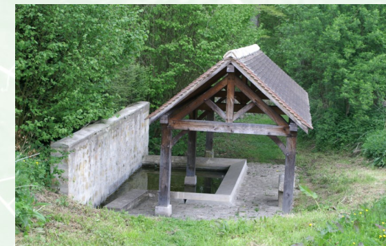
Lavoir de Gascourt