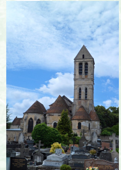
Eglise Saint-Côme et saint-Damien