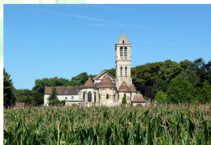
Eglise Saint Côme et Saint Damien