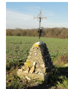
Croix Sainte Elisabeth