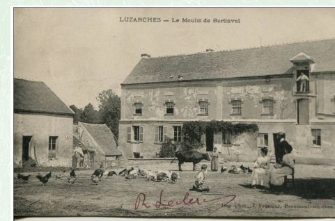
Moulin de Bertinval