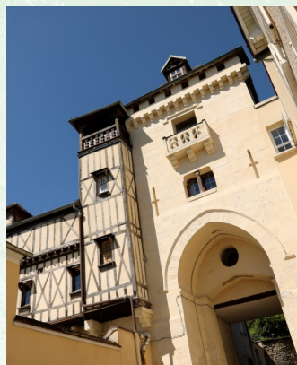
La Porte Saint-Côme