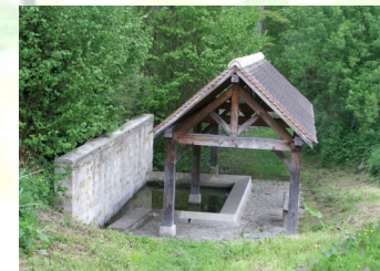
Lavoir de Gascourt