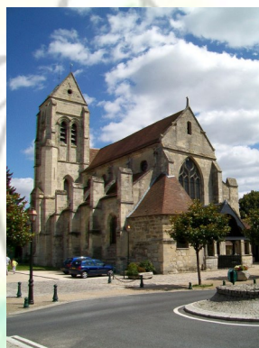
Eglise Saint Etienne Marly-la-Ville