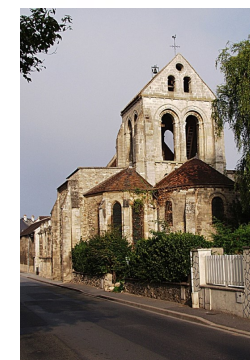
Eglise Saint-Etienne Fosses