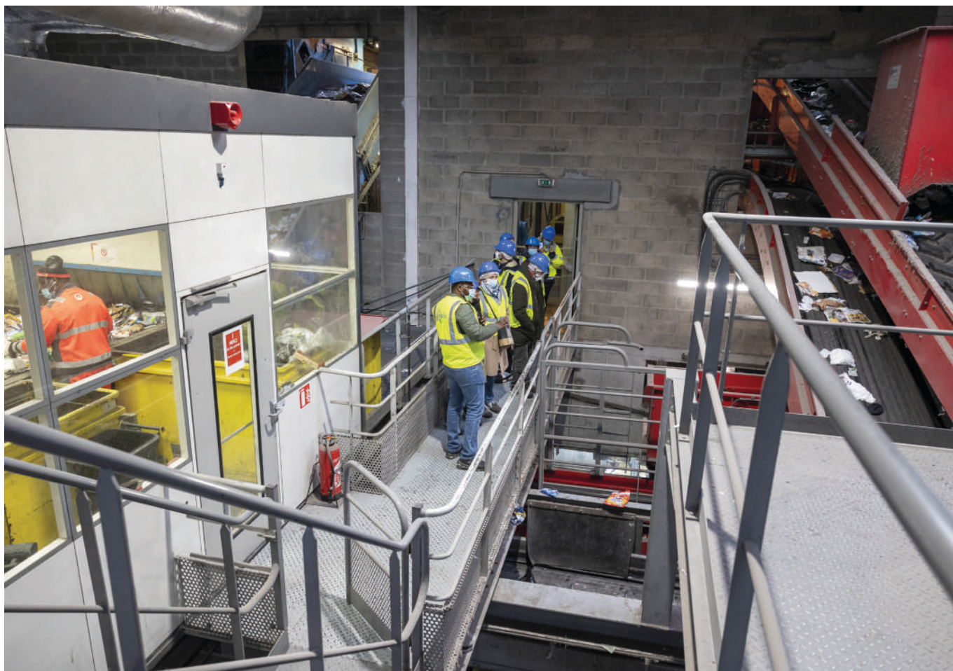
Visite des installations du SIGIDURS.

Deuxième étape : sensibiliser. Le SIGIDURS a organisé une visite de son centre de tri des emballages et papiers ainsi que de son centre de valorisation énergétique à destination des ordures ménagères. Une immersion au cœur des déchets et leur traitement, qui a permis aux 11 familles de visualiser la quantité de déchets jetée, mais aussi le travail et l'importance que représente la tâche du tri et de la valorisation des ordures.