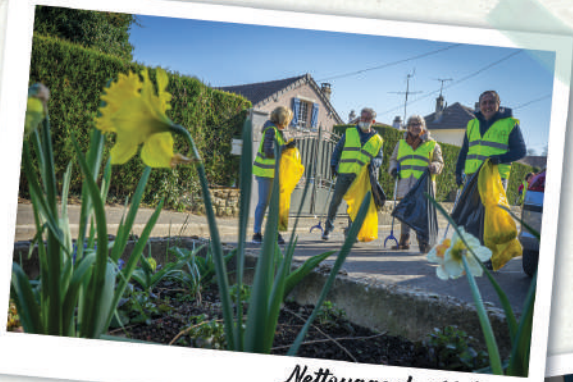
Nettoyage de printemps