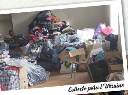
Collecte pour l'Ukraine