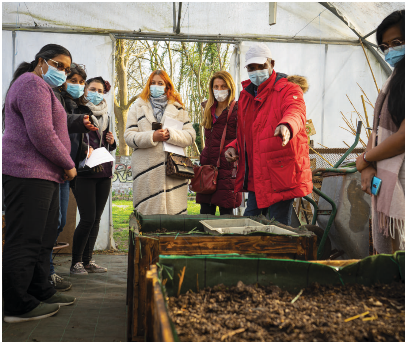
Atelier autour du jardin écologique proposé par le SIGIDURS

Lancé en janvier 2022 par le SIGIDURS, le syndicat intercommunal de tri et collecte des déchets pour Luzarches, le « Défi Zéro Déchet » s'adresse à des familles qui se sont déclarées volontaires pour réduire leurs déchets.