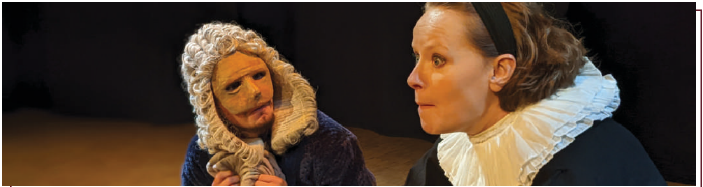
Les comédiens de l'Oreille en Verre, lors d'une représentation

L'association de théâtre de l'Oreille en Verre est à l'honneur grâce à la Communauté de communes Carnelle Pays-de-France, dans 9 communes de l'intercommunalité.