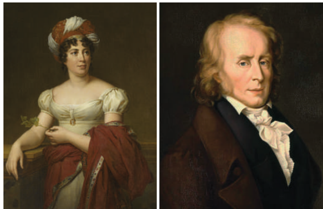
Germaine de Staël & Benjamin Constant

Comme toute jeune fille de famille aisée de l'époque, ses parents lui arrangent un mariage pour lui trouver une bonne situation. Elle est donc mariée au baron de Staël, ambassadeur de Suède à Paris, en 1786. La jeune femme entre ainsi dans la noblesse et se trouve une place de choix dans les sphères politiques françaises. Elle ouvre