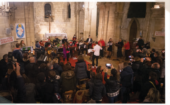
Concert de l'école municipale de musique