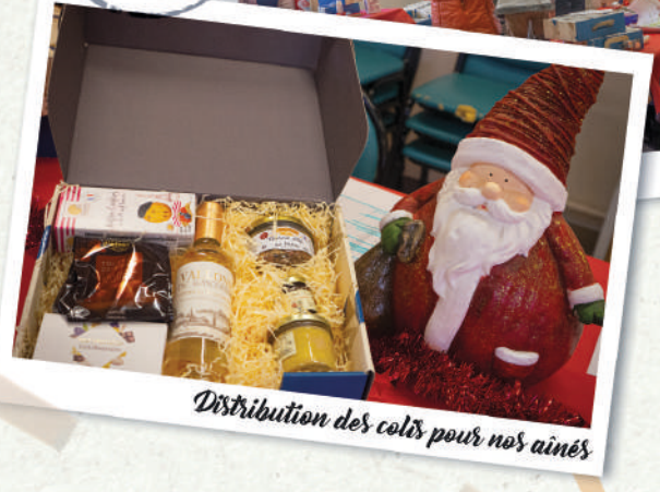
Distribution des colis pour nos aînés