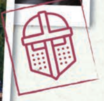
Salon des Artistes Luzarchois