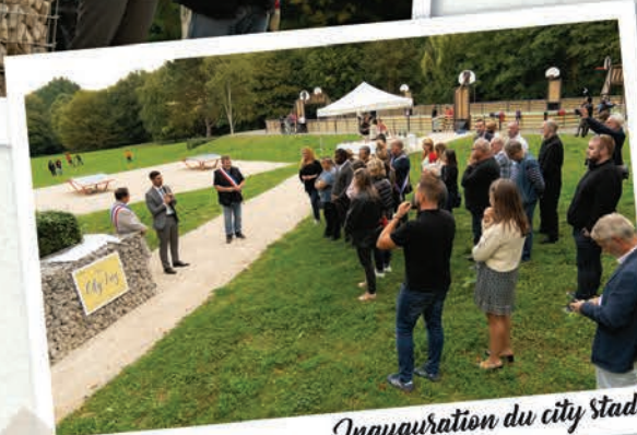
Inauguration du city stade