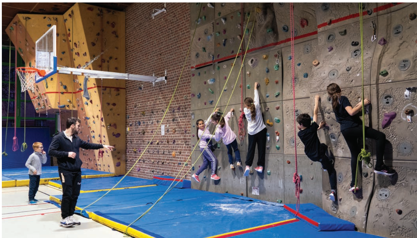
Atelier d'initiation à l'escalade (uniquement en prises basses)

Afin d'encourager la pratique sportive chez les jeunes, la ville de Luzarches a récemment recruté un éducateur sportif dédié à l'animation sportive pour les enfants de l'accueil de loisirs, les temps du midi et périscolaires ainsi qu'avec les enfants scolarisés de l'école Louis Juvet sans oublier les 11-15 ans qui pourront bénéficier de stages sportifs pendant les vacances. Une initiative qui place le bien-être et la santé des enfants au centre des priorités de notre commune !