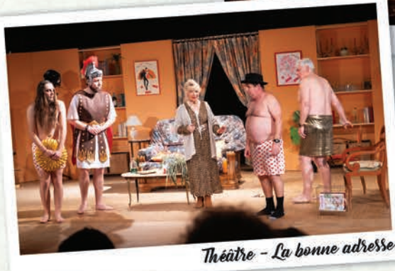
Théâtre - La bonne adresse