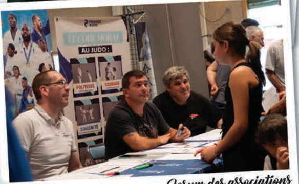
Forum des associations