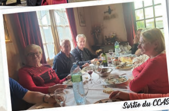
Sortie du CCAS